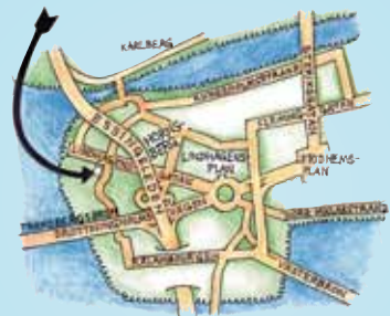
HORNSBERG, Lindhagensgatan 133