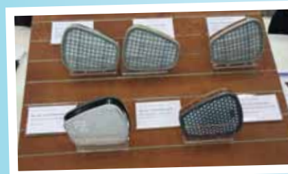
Gasfilter 3M som har unik indikator som visar när filtret är förbrukat.