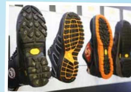
Skor från Helly Hansen med unik "andasfunktion" i sulan.