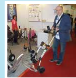
En väldigt stor hopfällbar magasinkärra (pirra) – bra för att flytta riktigt stora prylar.