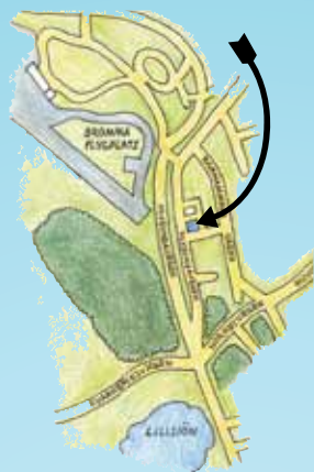
BROMMA, Ulvsundavägen 134