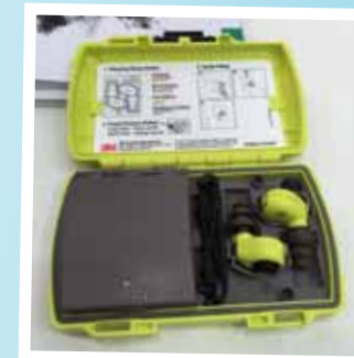
Hörselproppar med inbyggd medhörning. Laddas med AA-batterier eller USB.