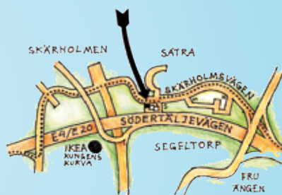
SÄTRA, Storsättragränd 12