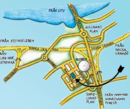
GLOBEN, Hallvägen 21