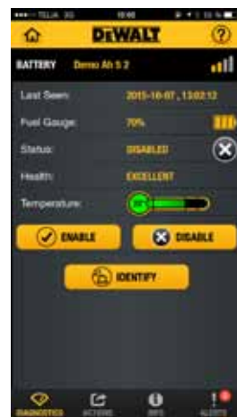
Se hur mycket kräm det finns kvar i batteriet via mobilen.