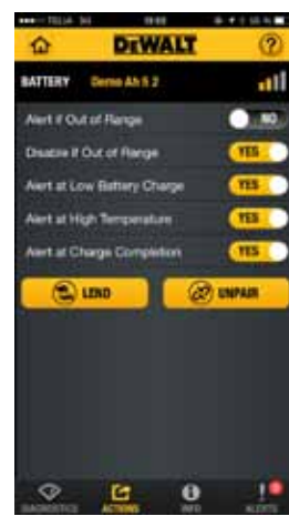
Du kan även låsa batteriet så att ingen annan kan använda det.