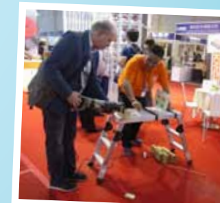
Ett nytt tigersågsblad testas. Mer om det i kommande nummer.