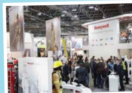
DÜSSELDORF. 1800 utställare visade upp de senaste prylarna inom personlig skyddsutrustning i åtta hallar.

För att ha koll på den senaste produktfloran har vi en ständigt pågående dialog med våra leverantörer. Årligen besöker vi flera mässor runt om i världen. Här är ett urval av produktnyheter som lanseras under 2016 från mässorna i Düsseldorf och Taiwan.