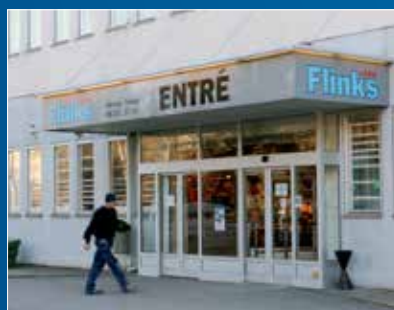
Sättra / Sydväst Storsättragränd 12