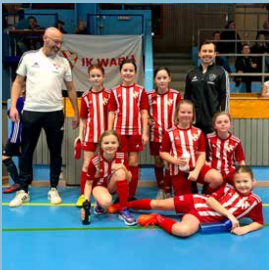
Flinks sponsrar idrotten med speciellt fokus på social hållbarhet.