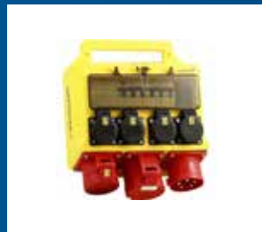
El, belysning och värme