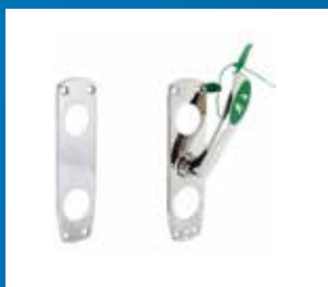
Lås, beslag och inredning