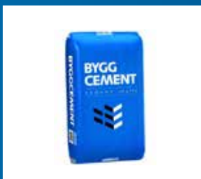
Byggvaror, formsättning och ventilation