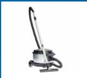
Städ och Pentry