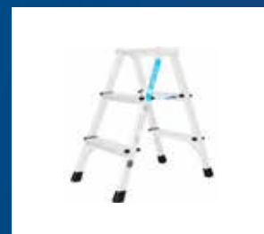
Stegar och Ställningar