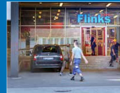
Hornsberg / Innerstad Lindhagensgatan 133