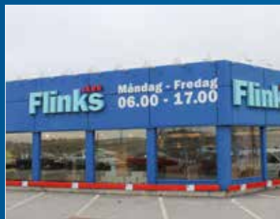
Bromma / Nordväst Ulvsundavägen 134