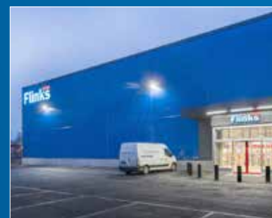
Täby / Nordost Mätslingan 28, Arninge industriområde