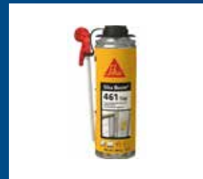
Lim, fog och färg