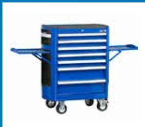
Arbetsplats och förvaring