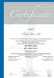
Vi är miljöcertifierade enligt ISO 14001, kvalitetscertifierade enligt ISO 9001 och arbetsmiljöcertifierade enligt ISO 45001.

Vi försöker även att bidra till social hållbarhet. Vi sponsrar idrott med speciellt fokus på ungdomar som kanske inte har de ekonomiska förutsättningarna för att köpa utrustning eller åka på träningsläger.