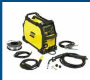
Svets, löd, gas och gasol