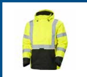
Arbetskläder och skor