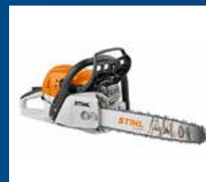
Redskap och trädgård