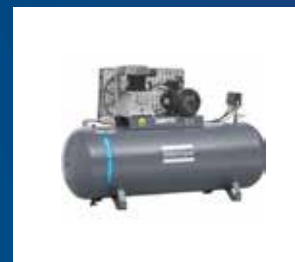
Tryckluft och Hydraulik